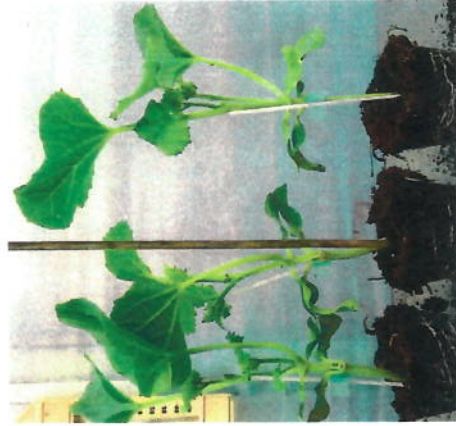
GRAFFIO (HMC 452638) F1** in confronto a Macigno dopo 5 giorni a 1° 20°

Continua ad aumentare l'apprezzamento e l'utilizzo di VIGUS come portainnesto, esso deriva dalla nostra linea di ricerca dei meloni lisci (Pamir, Bacir, Saphir, Dolciri) e ormai da qualche anno è utilizzato sia dai vivaisti, per la sua pianta solida e di elevato diametro che facilita l'innesto, sia dai coltivatori, che gradiscono particolarmente il vigore che trasferisce alla pianta che resta verde più a lungo rispetto ai precedenti portainnesti. Inoltre, trattandosi di un melone liscio migliora ed esalta l'aroma dei meloni raccolti.